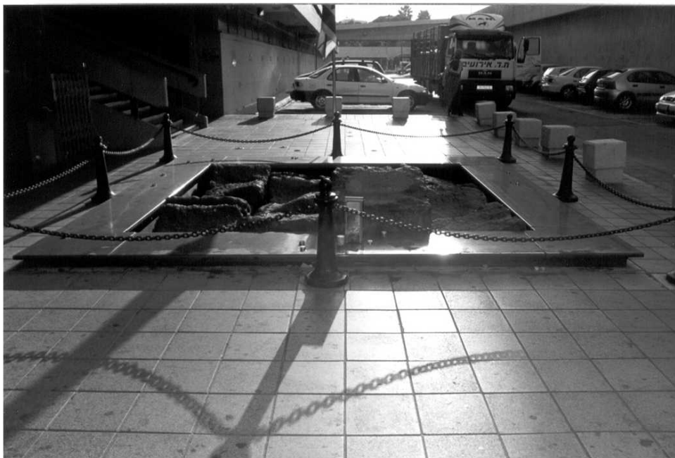
כיכר רבין, אתר ההנצחה ליצחק רבין, אוגוסט 2003.