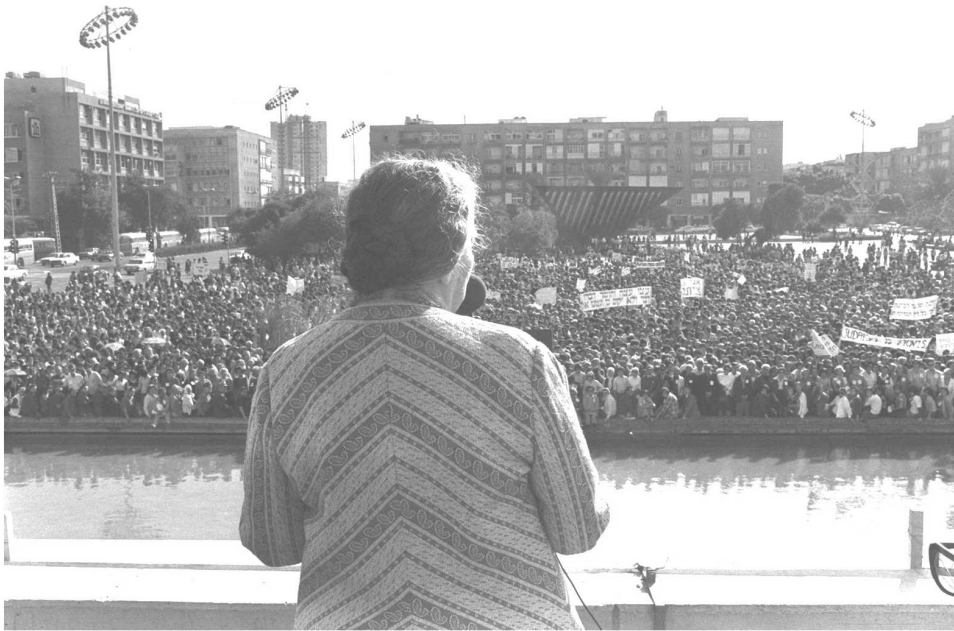
גולדה מאיר, 13 בנובמבר 1975.